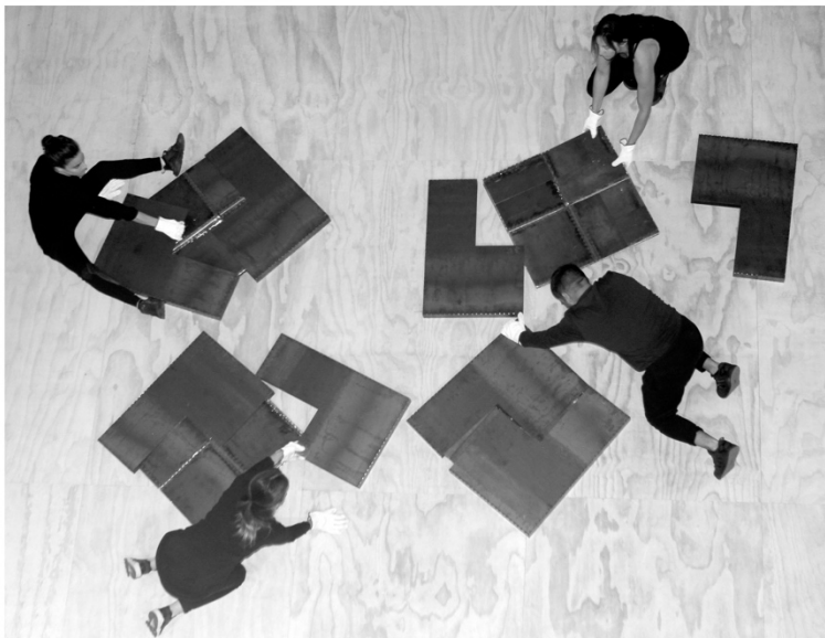
Performance Dignidad , Archivo Nacional de Chile, Santiago, 4 de Octubre, 2018